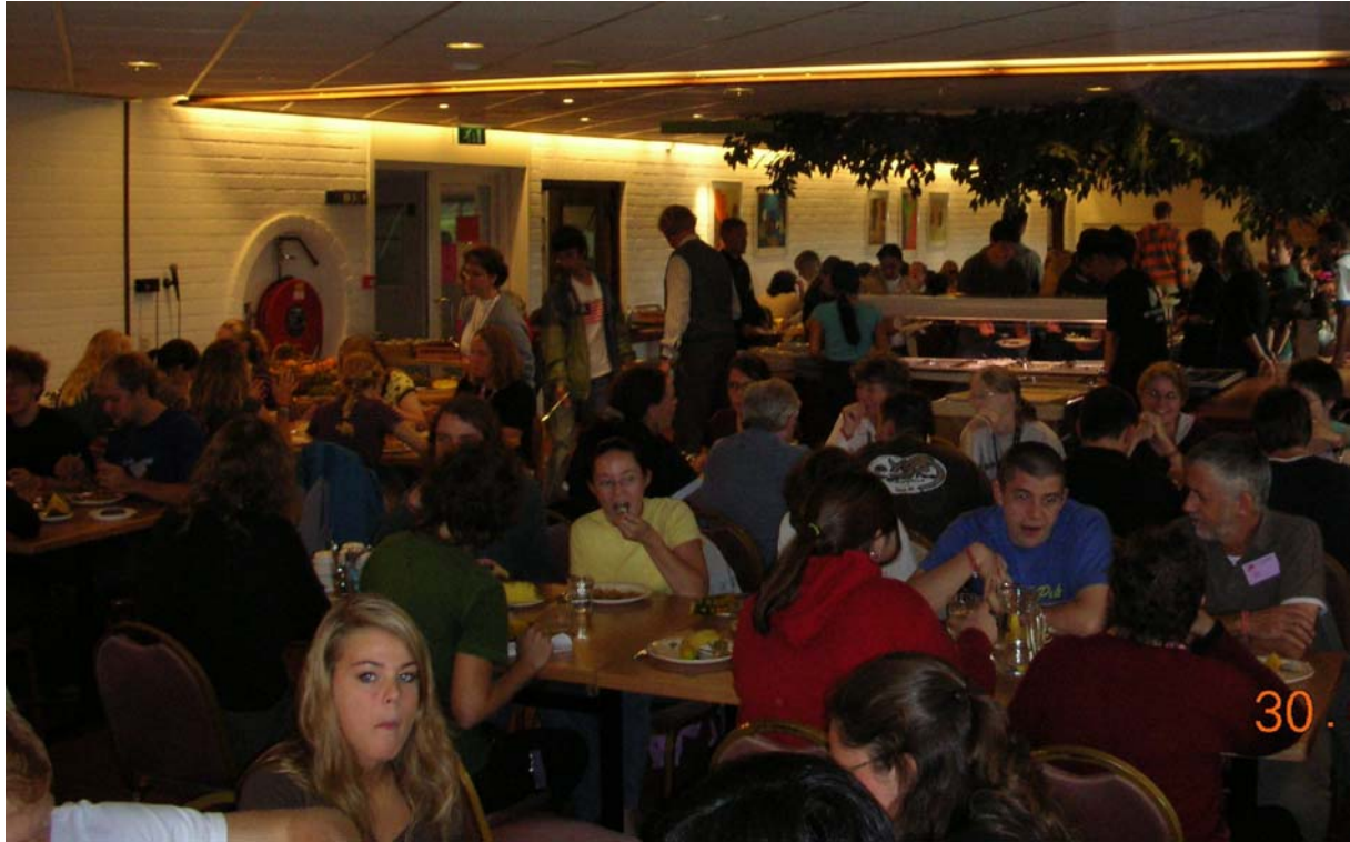
Beim gemeinsamen Essen