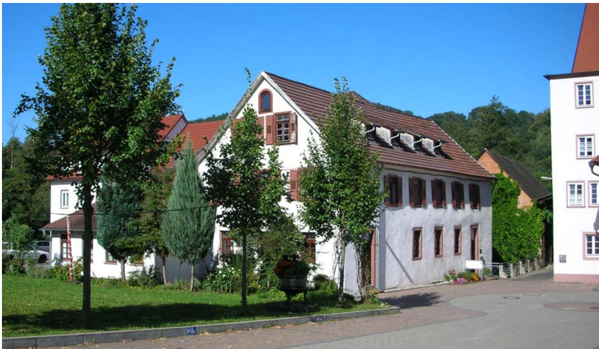
Das internationale Schiffsbüro von OM in Mosbach