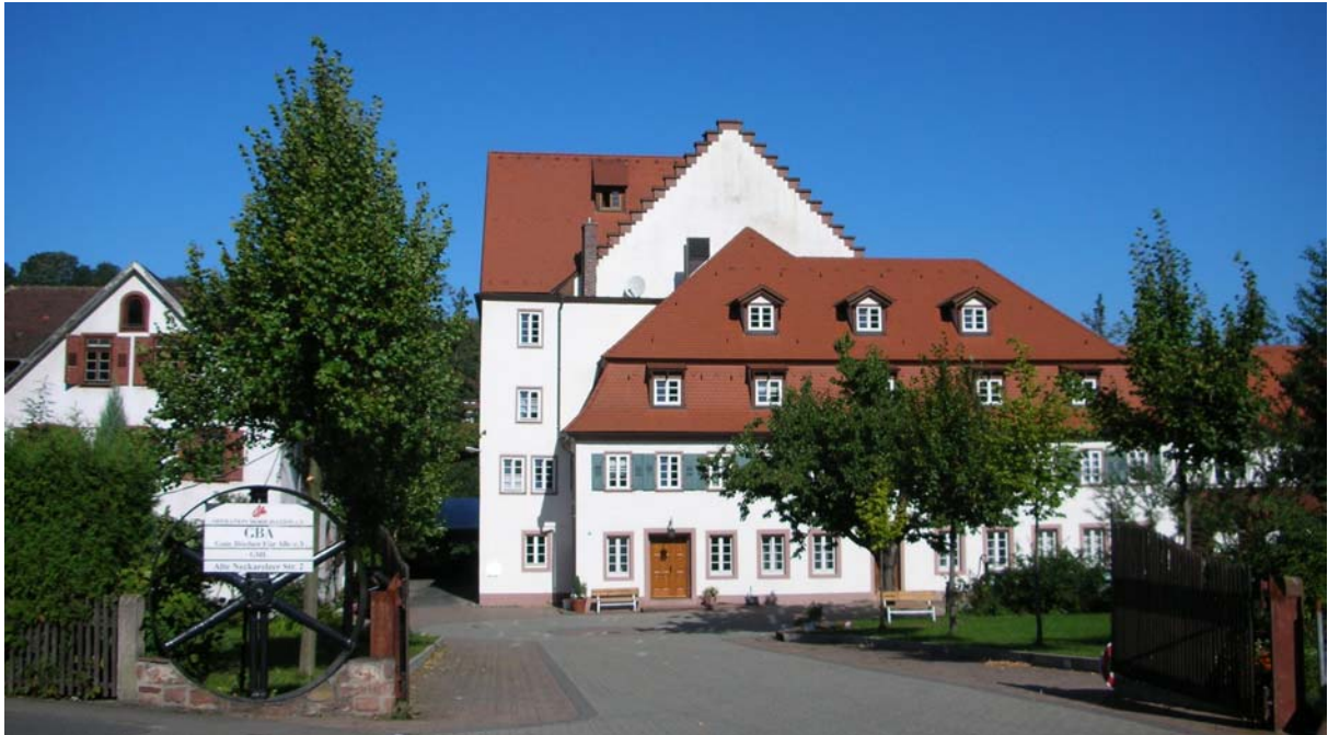
„Die Mühle“, Sitz von OM-Deutschland (Unser Quartier für 1 Woche)