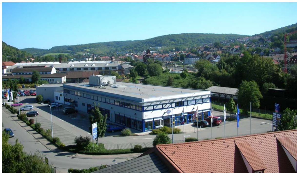
Blick über Mosbach vom Zimmer