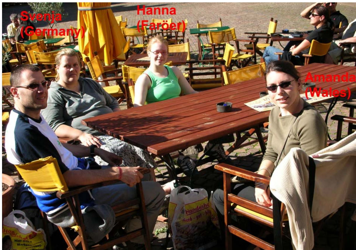
Ein Teil vom „1. offiziellen Logos HOPE pre-ship“